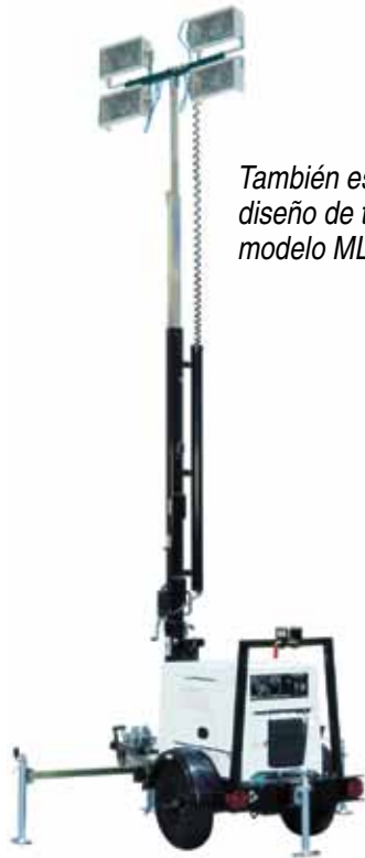
También está disponible en diseño de torre de luz como el modelo MLTSDW7