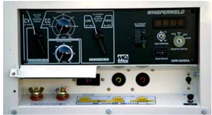
Instrumentación completa incluyendo los controles para ambas soldaduras de CC y CV.