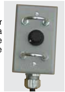
La DLW400ESA permite que dos operadores puedan soldar simultáneamente — cada uno con su propio control remoto.

El control remoto opcional permite al operador ajustar el amperaje hasta 100 pies de distancia de la máquina. La DLW400ESA permite que dos operadores puedan soldar simultáneamente cada uno con su propio control remoto.