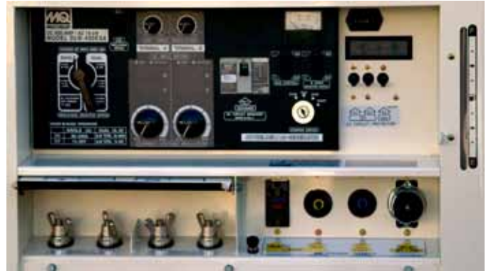
La pantalla LED proporciona una lectura clara de las características de carga para dos operadores.