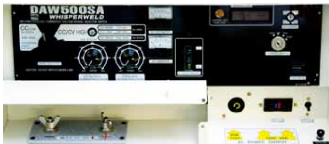
Instrumentación completa incluye voltímetro CD y amperímetro.